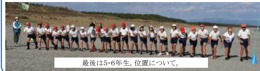
最後は5・6年生。位置について。

くれました。走り終わった子どもたちの様子を見ると、「力を出し切った。」と満足げな顔をしていました。子どもたちは、最高の天気と最高の応援をもらって走ることができました。応援して下さった保護者の皆様、祖父母様、地域の皆様、ありがとうございました。また、毎年海がめマラソンの開催に合わせて海岸をきれいにしてくださるシルバー人材センターの皆様には大変感謝しております。