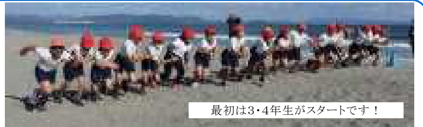
最初は3・4年生がスタートです！

12月3日(金)、好天の下、毎年恒例の海がめマラソンを横瀬海岸で行いました。寒さが心配されましたがとても暖かい日で、走りやすい気候となりました。子どもたちは、これまで朝のランニングや体育の授業で、それぞれめあてをもって練習を重ねてきました。歩くだけでも大変な砂浜でしたが、たくさんの方の応援を受けて、精一杯の力で走り、全員完走、全員満足のゴールを見せて