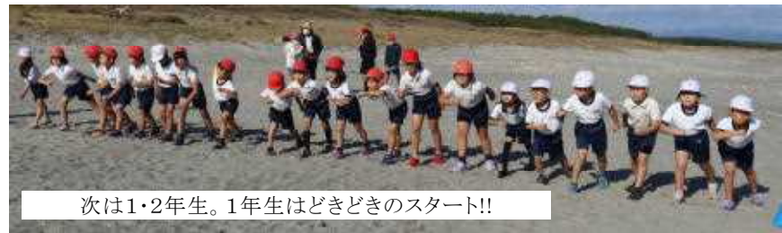
次は1・2年生。1年生はどきどきのスタート!!

くれました。走り終わった子どもたちの様子を見ると、「力を出し切った。」と満足げな顔をしていました。子どもたちは、最高の天気と最高の応援をもらって走ることができました。応援して下さった保護者の皆様、祖父母様、地域の皆様、ありがとうございました。また、毎年海がめマラソンの開催に合わせて海岸をきれいにしてくださるシルバー人材センターの皆様には大変感謝しております。