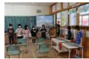
【1年生 できるようになったよ】