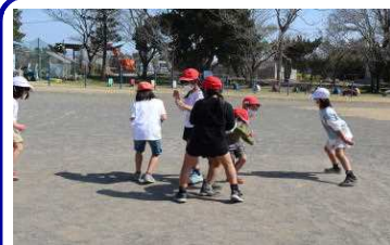
昼休みの風景 2年生