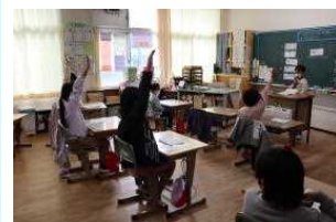
【2年生 明日へジャンプ】