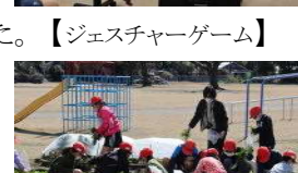
【ジェスチャーゲーム】