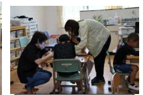
まなび 国語の授業