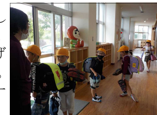
【1年生の避難の様子】

5月8日(土)に児童引き渡し訓練を行いました。不審者、台風、豪雨、地震等の時、実際、重要になるのが訓練です。御協力のおかげで、時間内にスムーズに行うことができました。ありがとうございます。また、今回の訓練でコース等の課題も見えてまいりました。子どもたちの安全を一番に考慮していきます。