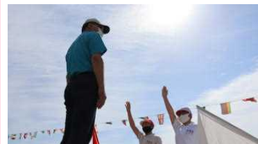
開会式 ~応援団長の選手宣誓