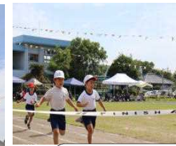
かけっこ・リレー ~見事な走りを見せ、走力を競い合いました。