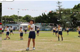
下学年 表現 ~make you happy みんなとてもかわいかったです。