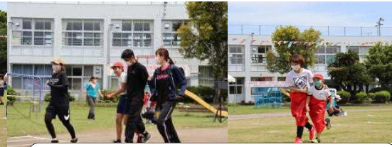
親子種目:1年生「心をついに、レッツゴー」 6年生「夢にときめけ・明日にはばたけ」