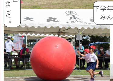
途中のグリン グリンも楽し ました。