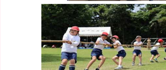
「綱引き」~児童は上下学年に分かれて綱引きをしました。 迫力ある綱引きはとても盛り上がりました!