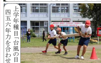
上学年種目「台風の目」 四五年生力を合わせました。