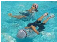
【ペットボトルを使って浮かぶ様子】

今年は、夏休みのプール開放・9月の水泳発表会もできませんでしたが、1学期いっぱい楽しく水泳学習を行い、みんな上手に泳げるようになったようです。