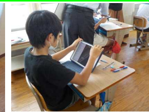
【タブレット保管庫】 【タブレットを使っている様子】