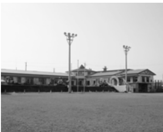
▲完成間近の野方保育所