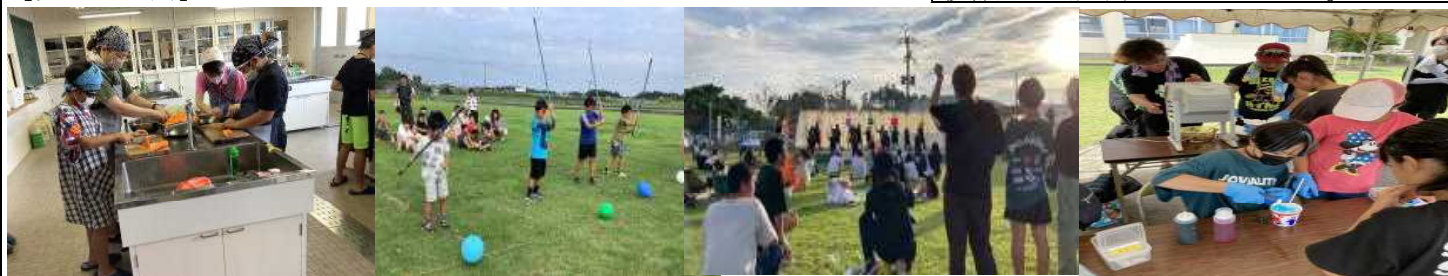
親子ディキャンプ