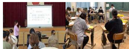
学校保健委員会 学級PTA