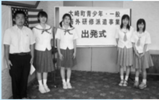
▲大崎町青少年・一般海外研修派遣事業