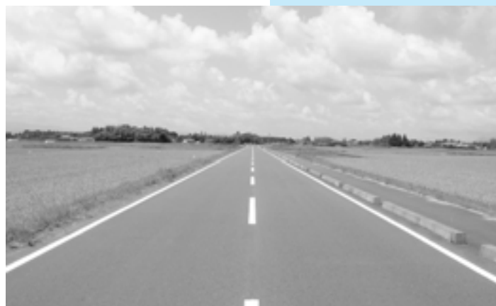
▲大隅中央区域農業用道路（大隅グリーンロード）