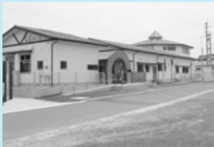
▲改築された野方保育所