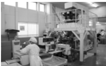
▲自動給袋機（袋詰作業）