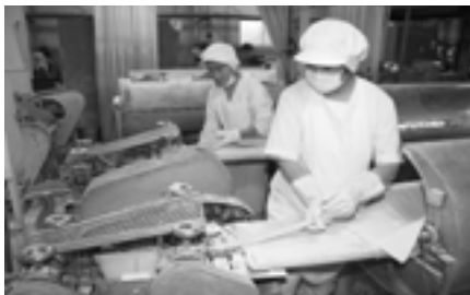
▲からいも飴の成型