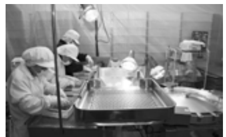
▲キャンディーの選別作業