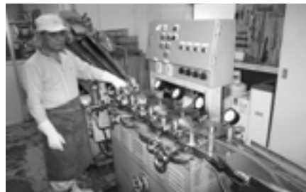
▲キャンディーの成型