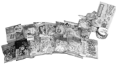
▲『からいも飴』をはじめとした取り扱い商品の一部

これからも消費者の方々においしく、そして安心して召し上がっていただけるよう、より良い商品づくりに努めてまいりますと思っております。