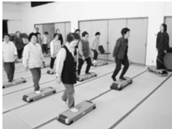
▲ステップ運動（体力に合った高さの調節が可能）