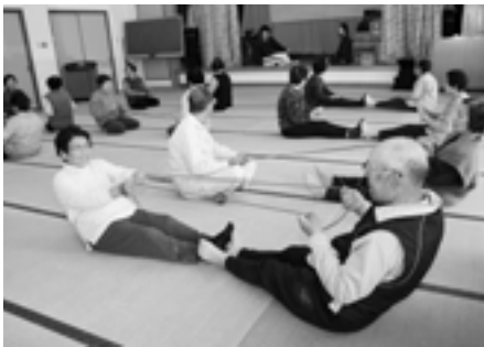
▲ゴムひもを使った運動（腕の筋力を向上させる効果があります。）

平成16年度から展開している『マスターズプロジェクト事業』では、高齢者の方々が体力・筋力の維持向上を図ることで、いつまでも健康で元気な生活を送れるように、鹿屋体育大学による運動指導や運動普及推進員によるレクリエーション等を実施しています。 本年度は老人福祉センターと野方活性化センターの2か所で行います。(下記日程表を参照) 65歳以上の方ならどなたでも参加できますので、お気軽にお越しください。 ※高血圧等で病院にかかっている方、主治医に相談のうえ、ご参加ください。