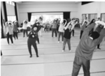
▲準備体操（筋肉の緊張をほぐし、血流を良くします。）