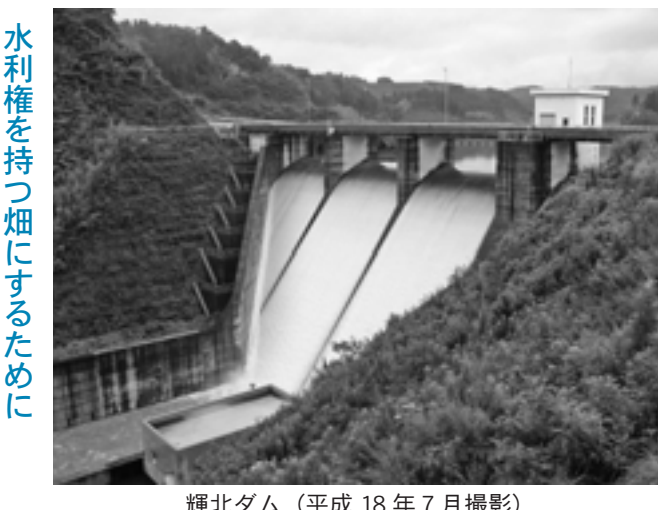
(平成 18年7月撮影) 輝北ダム

水が始まります。今回通水する面積は、 ル、大崎町では195ヘクタールの予定です。 平成19年度から曽於南部畑かん事業実施区域の一部で本格通 全体で585ヘクター