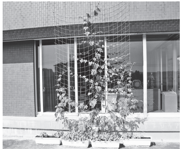
『“にがごい”カーテンで涼しく!』

大崎町職員互助会では、オリジナルポロシャツを自費制作し、クールビズに取り組みます!