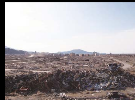
大船渡市に隣接する陸前高田市・・・言葉もでませんでした。