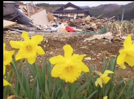
ガレキのそばでたくましく咲き誇る黄水仙。