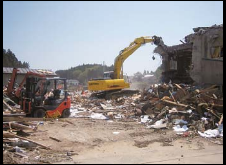
重機を利用して被災した建物の解体作業が始まっています。