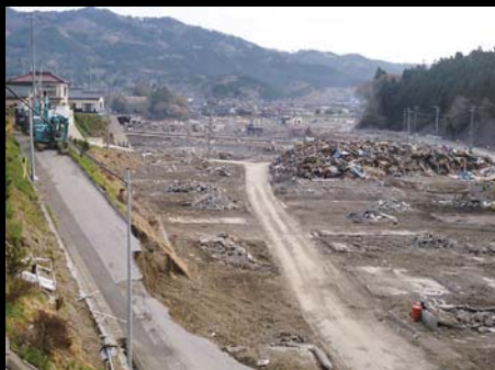
一面更地になった地域と難を逃れた高台の家。