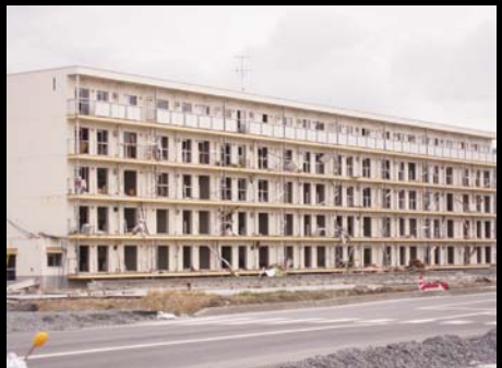
陸前高田市の4階部分まで水没したアパート。