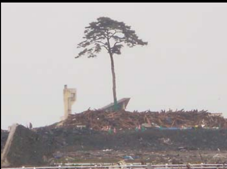
メディアでも注目をあびた陸前高田市の唯一残った根性一本松。