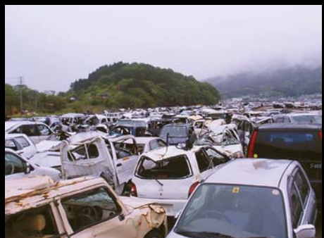
港に集められた被災した車両。その数は2600台。