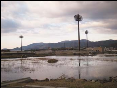
陸前高田市の海に沈んだ野球場です。海岸沿いは、すべて水の中でした。