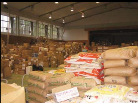
全国から届けられた支援物資で体育館は埋め尽くされていました。