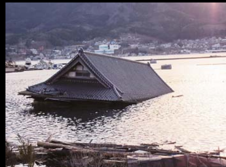
津波で流された家が海に沈んでいました。