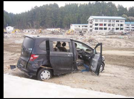
大津波で流された車両が至る所に散乱していました。