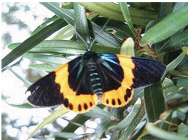
キオビエダシャクの成虫