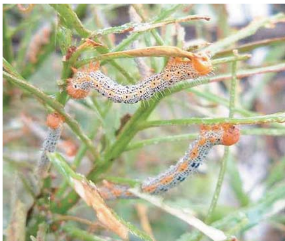
キオビエダシャクの幼虫