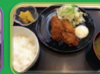
木 カニフライ定食