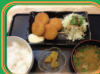
火 カニマackerelフライ定食