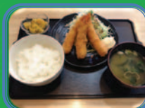
月 エビフライ定食