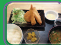
水 ミックスフライ定食