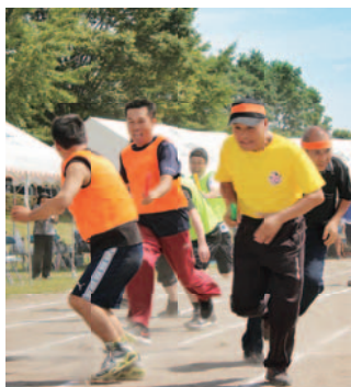
力走!! 母校のために

来年4月に町内3中学校が1つに統合されことに伴い最後の運動会となった大崎第一中学校。閉校記念種目の『年代別リレー』では、参加者たちはそれぞれの思いをバトンで繋いでいました。