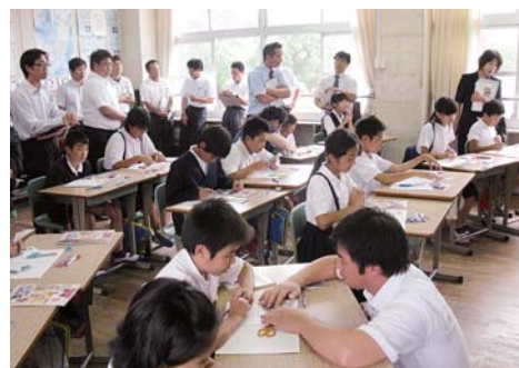
▲小中連携研究会での算数授業

1年生 15名 ・ 4年生 20名 2年生 11名 ・ 5年生 16名 3年生 14名 ・ 6年生 14名