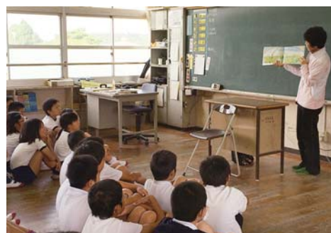
▲PTA文化部による読み聞かせ