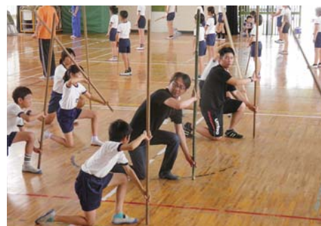
▲保存会の方々の『棒踊り』指導