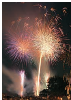
『心に響く大崎の花火』

大崎七夕さあで打ち上げられた花火は1200発。大きく、美しい花火はきっと皆さんの心を奪ったことでしょう。