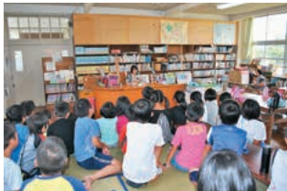
P T A文化部による読み聞かせ