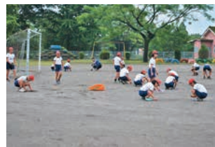
朝のボランティア活動