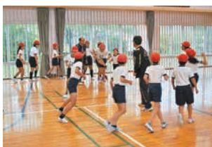
目指せなわとび名人