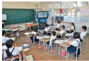
I C T 機器の活用