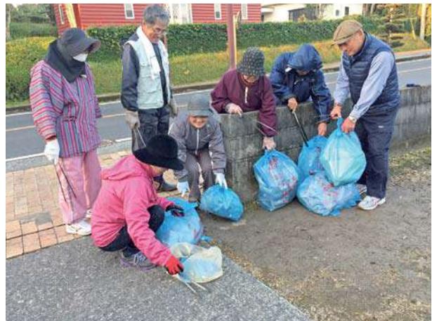
▲集落一斉清掃の様子