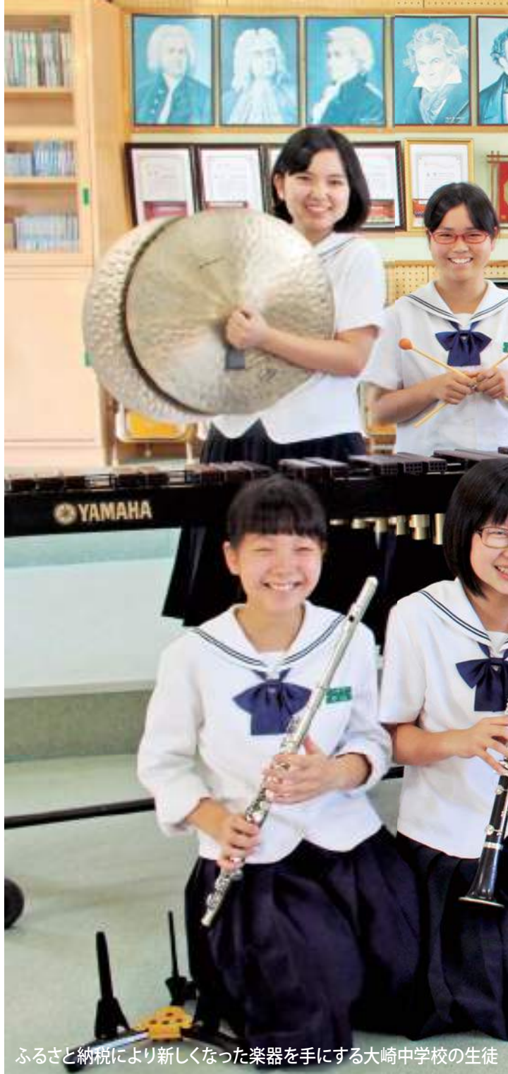
ふるさと納税により新しくなった楽器を手にする大崎中学校の生徒

「鰻、黒豚、さつま芋など海・山・里の幸に恵まれた大崎町の皆様が羨ましく思います。自然を大切にし、生かして町が更に発展するよう祈ります。」