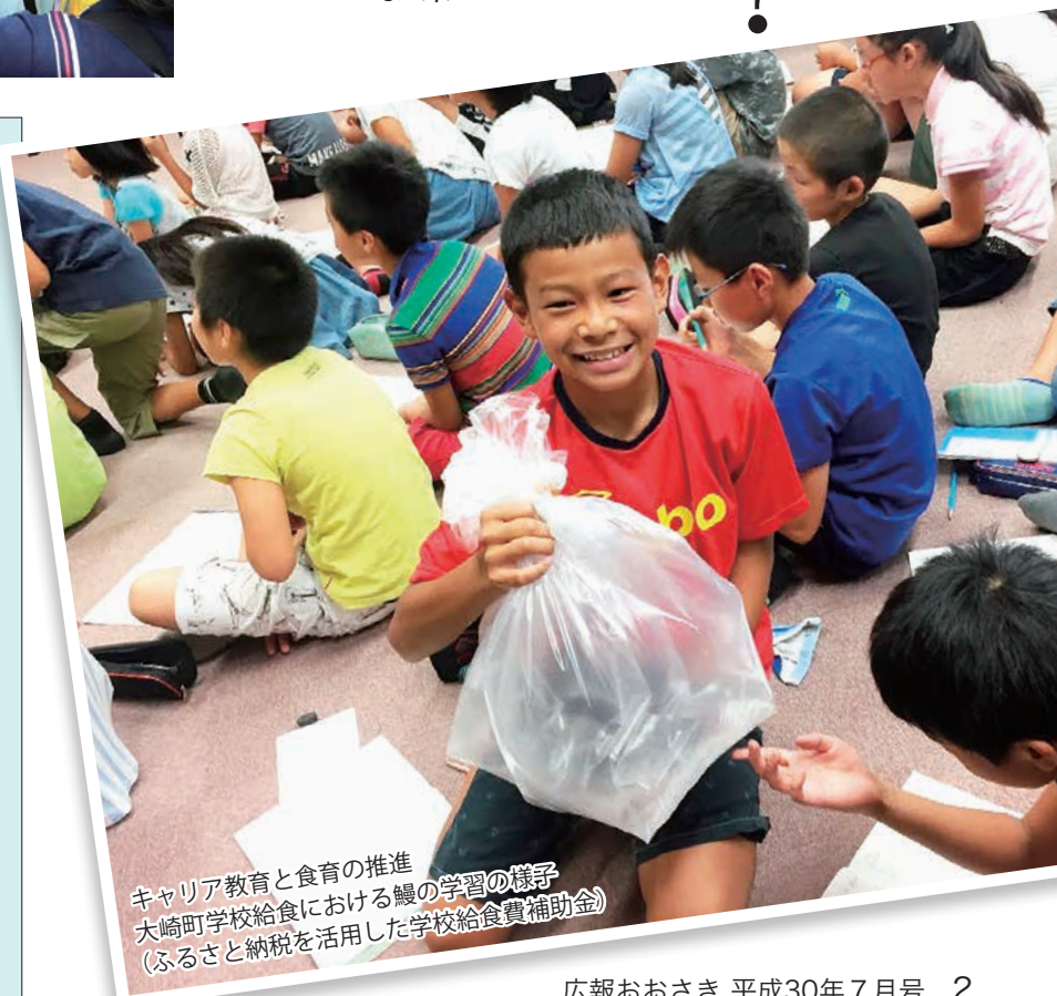
キャリア教育と食育の推進 大崎町学校給食における鰻の学習の様子 (ふるさと納税を活用した学校給食費補助金)