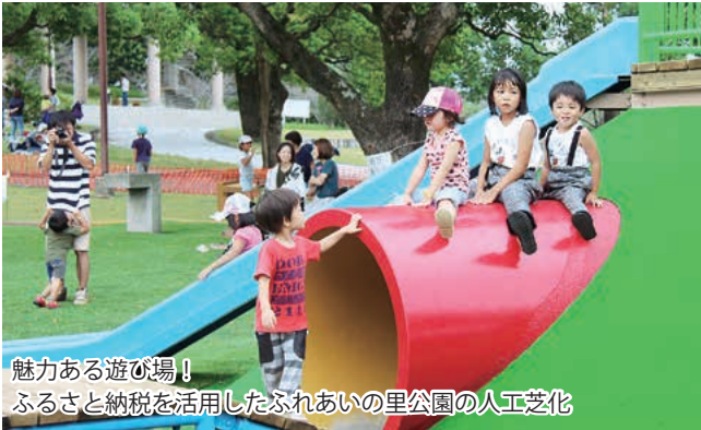
魅力ある遊び場！ ふるさと納税を活用したふれあいの里公園の人工芝化