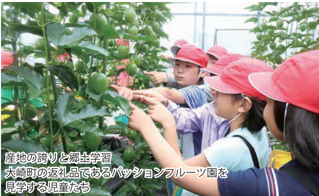
産地の誇りと郷土学習 大崎町の返礼品であるパッションフルーツ園を見学する児童たち