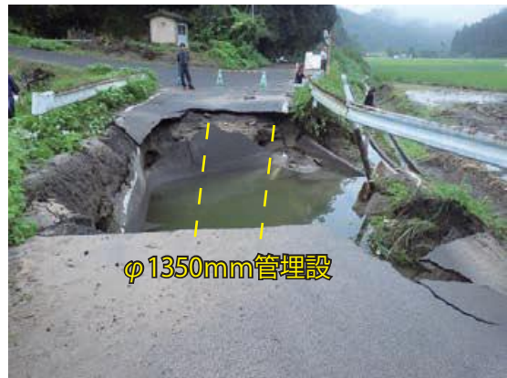
【鹿屋市輝北町平房地内】

発生日：8月25日 道路下に埋設されている、1,350mm径の導水管から漏水し、道路が流されて崩壊している。