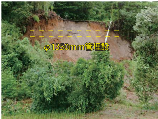
【鹿屋市輝北町平房地内】

発生日：7月4日 導水管が埋設されている道路の路肩が崩落し、導水管の損傷の恐れがある。現在通行不可