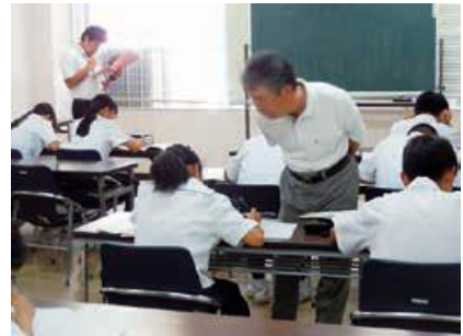
▲根気よく数学の問題に取り組む生徒