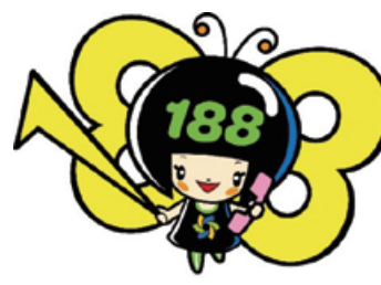
消費者ホットライン188 イメージキャラクター「イヤヤン」