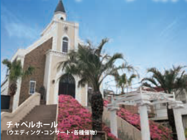
チャペルホール (ウェディング・コンサート・各種催物)