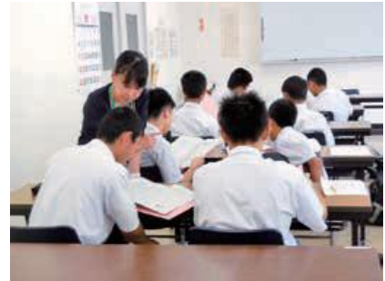
▲生徒の英語の発音の確認

これから受験までの大事な時間をどのように過ごせばよいか、改めて考えるきっかけにもなった有意義なセミナーとなりました。