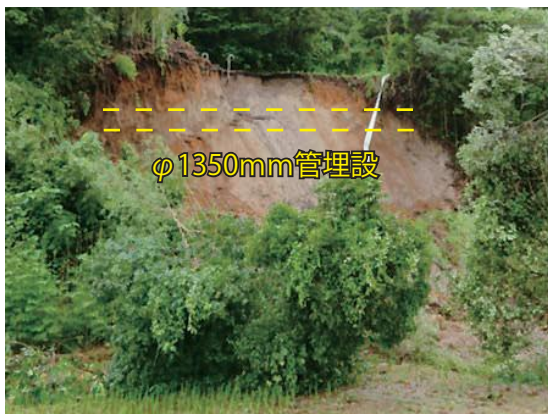
【鹿屋市輝北町平房地内】

発生日：7月4日 導水管が埋設されている道路の路肩が崩落し、導水管の損傷の恐れがある。現在通行不可