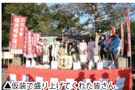
▲仮装で盛り上げてくれた皆さん