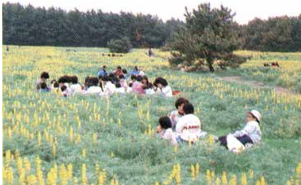
昭和63年当時の様子

今月は、会場について紹介します。ビーチバレーボール競技の会場名称は『大崎町ビーチスポーツ専用競技場』で、場所は大丸改善センターに隣接し、ビーチスポーツ専用競技場として整備されるまでは、ルーピンが咲き誇るのどかな風景でした。その場所で約50年に1度のスポーツの祭典が行われます！ぜひ応援にお越しく下さい！