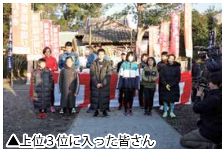
▲上位3位に入った皆さん