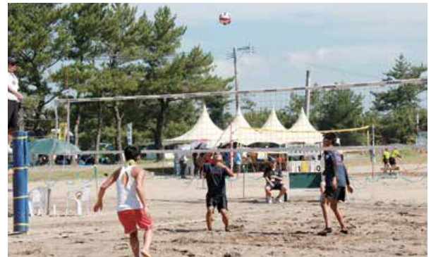
現在のビーチスポーツ専用競技場