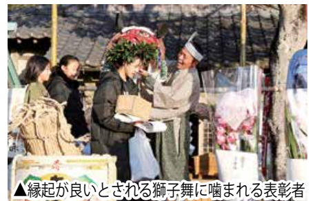
▲縁起が良いとされる獅子舞に噛まれる表彰者