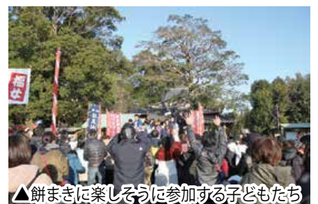
▲餅まきに楽しそうに参加する子どもたち