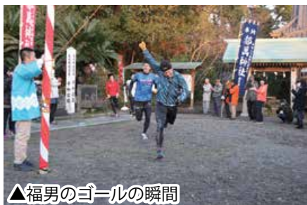
▲福男のゴールの瞬間