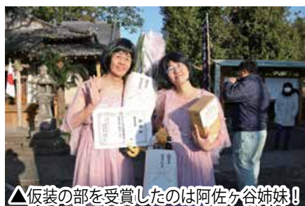
▲仮装の部を受賞したのは阿佐ヶ谷姉妹!