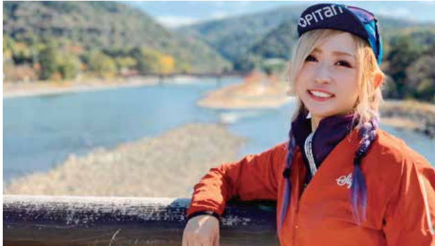
【スペシャルゲスト】 MIHO氏 (ユーチューバー)

大隅半島国道448号沿いの3町(肝付町・大崎町・東串良町)を巡り、自然・食・歴史を「ゆるっと！ぷらっと！」楽しむサイクリングイベントです。速さを競うレースではありませんので、ご家族・お友達と気軽にご参加ください。