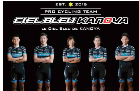
【ゲストライダー】 シエルブルー鹿屋プロサイクリングチーム