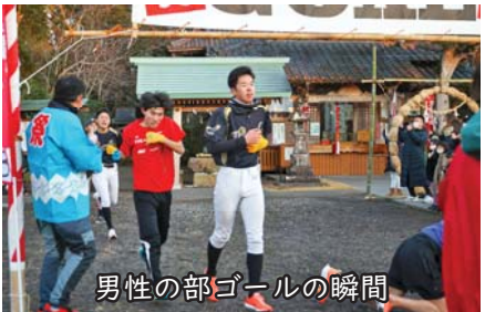
男性の部ゴールの瞬間