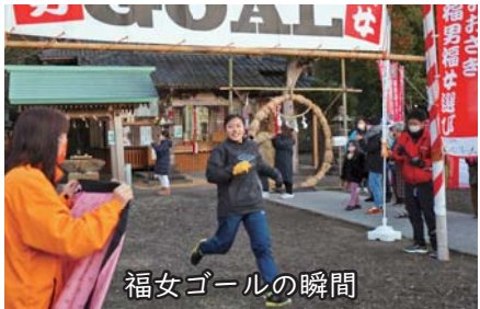
福女ゴールの瞬間