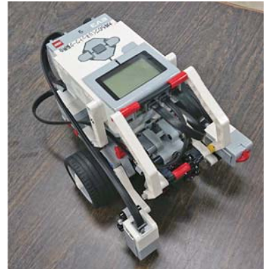
【寄贈されたプログラミングロボット】

将来の予測が難しい社会において、何が重要かを主体的に考え、見いだした情報を活用しながら他者と協働し、新たな価値の創造に挑んでいくためには、情報活用能力の育成が重要となる。