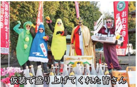
仮装で盛り上げてくれた皆さん