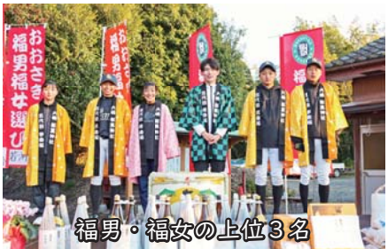
福男・福女の上位3名