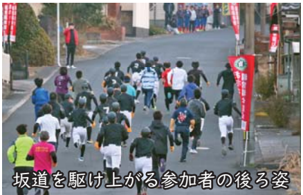
坂道を駆け上がる参加者の後ろ姿