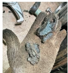
郵便局前MP場1号ポンプ他の故障(不織布、ネジ) ↑ →