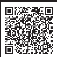
▲WEB版 大崎町 防災マップ