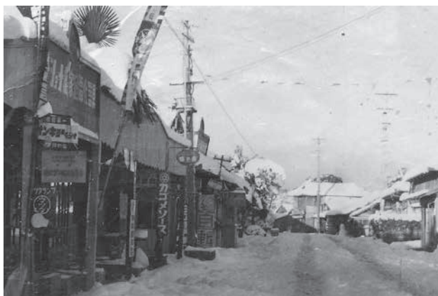
昭和34年の野方 にしまえストア前

※戦後(太平洋戦争)から昭和時代で大崎の歴史(風景・行事等)がわかるもの ※提供いただいた昔の写真は、広報や町史等で利用させていただく場合がございますので、ご了承ください。