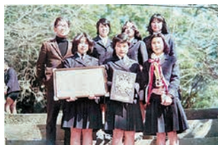
※優勝時、撮影された写真(後列、左上)