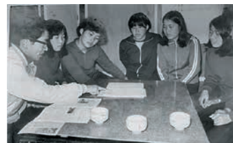
※ミーティング中の写真(左端)