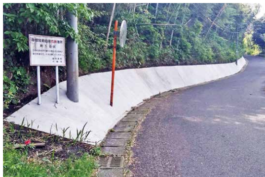
メンテナンスフリー工事 町道（飯隈一在郷線）

答 町長 関係課の予算やメンテナンスフリーなど防草対策予算も増額しており、農道を含め維持管理に努める。