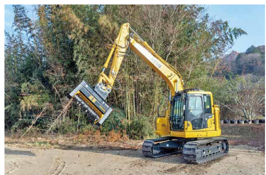
竹粉碎アタッチメント装着車両