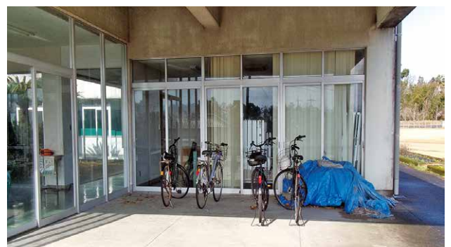
菱田改善センター駐輪場

答 教育長 菱田校区内の停留所として対応可能な土地で、公共の用地として管理されている場所であることから菱田線のバス停として選定している。