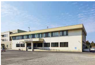
学びの多様化学校 悠志学園(志布志市)