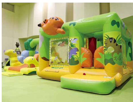
東串良町設置のエア遊具(MARUMARINE)

答 町長 エア遊具を活用した屋内型の遊び場や公園施設に屋根を設けるなど検討している。大規模なドームは財源とのバランスを考え検討する。