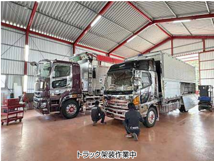
トラック架装作業中