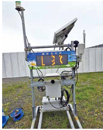
騒音測定器の設置

答弁 現場に騒音と振動を測定できる機械を設置しているが、影響と地域住民からの苦情等受けていない。