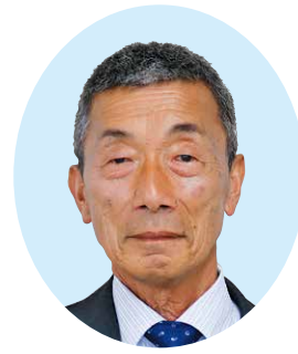
おかもと しゅういち 議員 岡元 修一

問 地域の力で続けてきた草刈りや側溝清掃が難しくなり、負担の偏りや竹林の荒廃が進んでいる現状を踏まえると、住民と行政が協力して暮らしを守る新しい維持管理の仕組みを考える時期に来ていると感じる。現状をどう見るか。