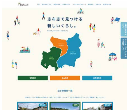
(志布志市が民間委託を行っている空き家バンクサイト)

答 町長 移住環境情報の掲載、物件の探しやすいなど改善の余地はある。また移住窓口等も必要だと考える。かかる費用や運営体制など十分に整理した上で判断したい。