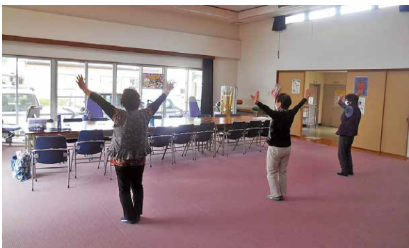
音楽に合わせて発声や体を動かす音楽体操

問 高齢者元気度アップポイント事業の取得ポイントの商品券に交換するために、役場本庁舎や野方支所に向かないといけな。ポイント事業を活用し、さらに利便性を向上できないか。