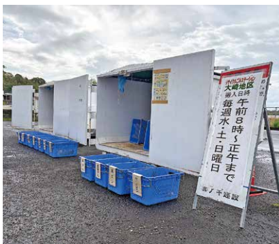
リサイクルゴミステーション大崎地区

内容の充実に取り組み。また、地域活動の支援や子育て支援の充実をはかることで、子育て世代にとって魅力ある環境を整備する。