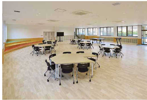
プレイルーム兼リビングルーム