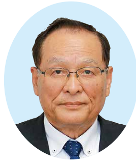
議員 幸博 幸博 富重

問 町長は、どのような政治姿勢、信条のもとに対話でつくるみんなの未来「いくつになっても安心して暮らせるまち」をはじめ、5つの公約を掲げられたか。