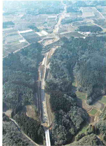
●東九州道（荒谷地区）の整備状況