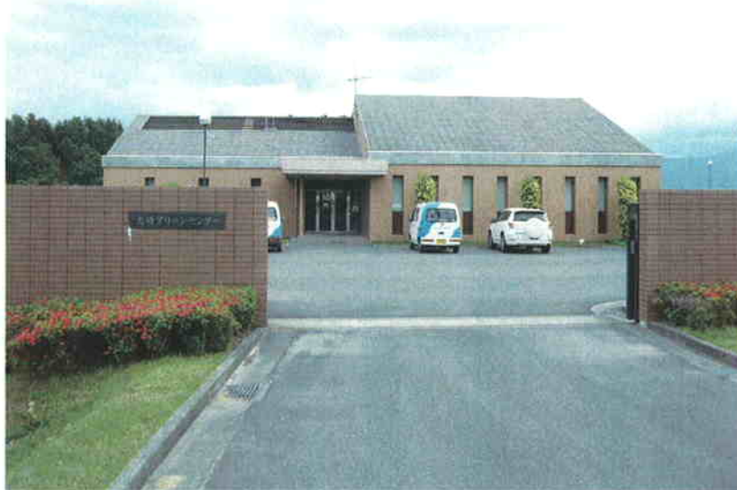
●大崎町クリーンセンター