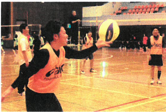
自治公民館対抗 ミニバレー大会