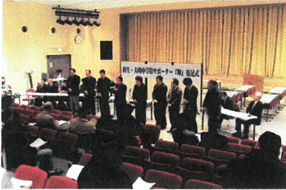
大崎中学校サポーター「輝」発足式の様子