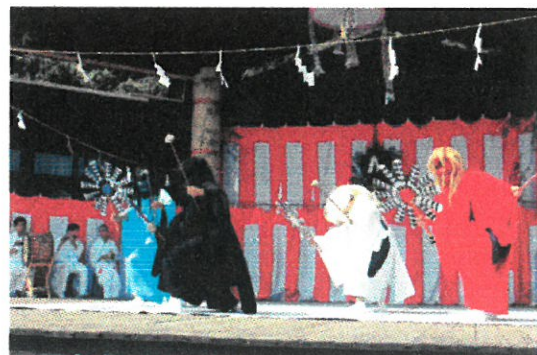
文化財 照日神社神舞