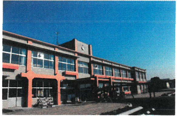
改築された大崎中学校