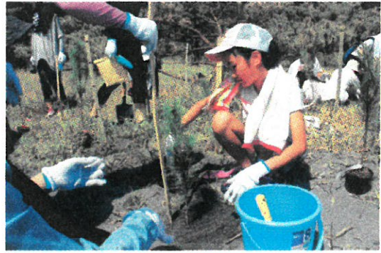
クロマツの苗木を植林する児童の様子