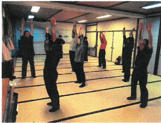
生涯学習講座 太極拳