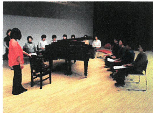
生涯学習講座 女声コーラス