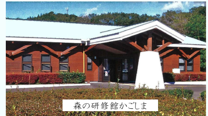
森の研修館かごしま