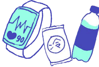
ウェアラブル端末、 応急セット