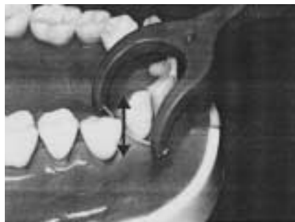
歯間ブラシによる清掃

である歯周病を予防するためには、デンタルフロスや歯間ブラシはなくてはならないものです。正しい使用法を、かかりつけの歯科医院などで指導してもらいましょう。一日に一回使えばよいので、ぜひ、多くの人に使っていただきたいと思っています。