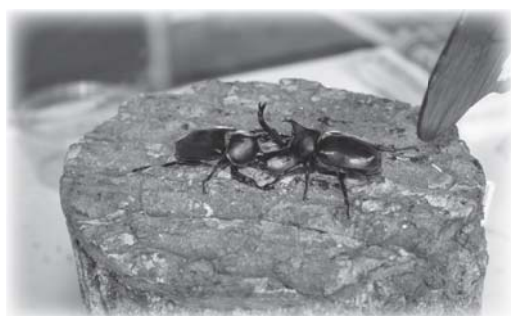
▲相撲…直径20cmの土俵での真剣勝負！

毎年、夏休みに入って初めの日曜日に開催されている『カブト虫相撲大会』が大崎町総合体育館において7月20日(日)に開催され、県内外から約1,000人の親子連れが訪れました。 この大会は、生態の観察学習によって自然の成り立ちを知り、昆虫への愛情を深め、情緒豊かな人間性を創造することを目的として、社会福祉法人愛生会が毎年行なっているもの