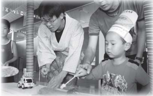
▲自分より何倍もの玩具を引っ張るカブト虫