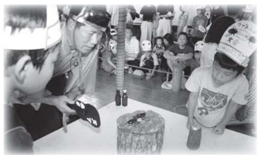
▲「はっけよい のこった！」