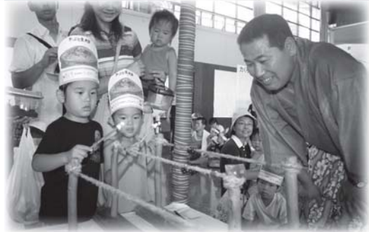
▲綱わたり…50cmの綱をどれだけ早く渡れるかを勝負