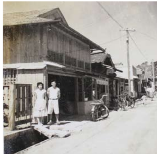
▲昭和20年代の三文字中央通り風景