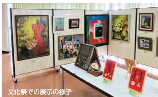
文化祭での展示の様子

★上記内容についてご不明な点がございましたら下の連絡先に、お問い合わせください。